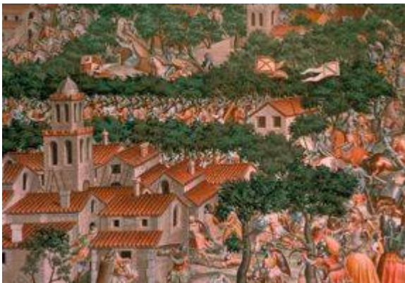
Batalla de la Higuera (6)