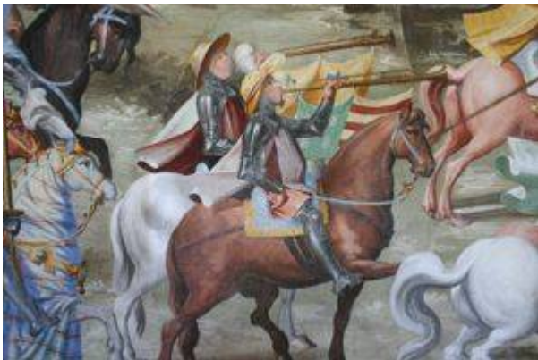
Batalla de la Higuera (5)