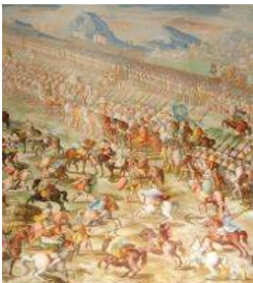
Batalla de la Higuera (2)