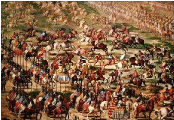
Batalla de la Higuera (1)