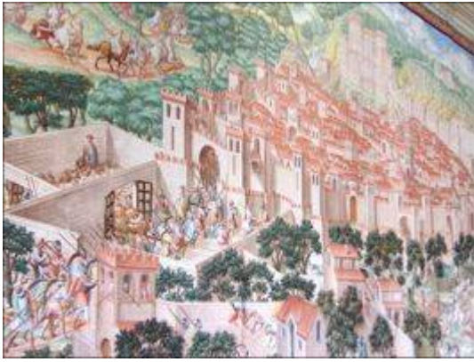
Batalla de la Higuera (7)