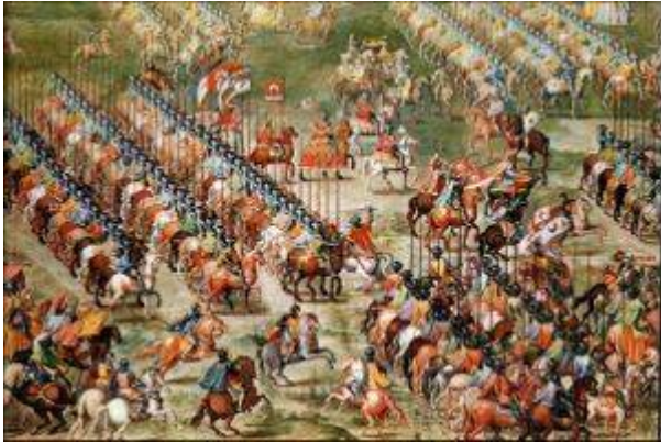
Batalla de la Higuera (4)