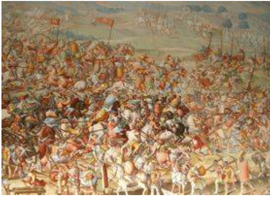
Batalla de la Higuera (3)