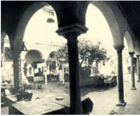
Antiguo claustro del convento de las Vírgenes