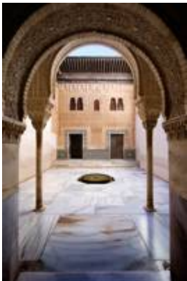
Cuarto dorado (Alhambra)

"http://www.youtube.com/embed/W3VwXlnqu4?iv_load_policy=3&fs=1&origin=http://www.historicalsoundscapes.com"