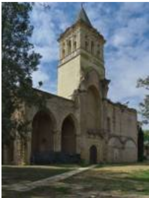
Campanario del convento de San Jerónimo de Buenavista. Fotografía de José Luis Filpo Cabana