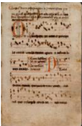
Cantoral Jerónimo (c. 1470)