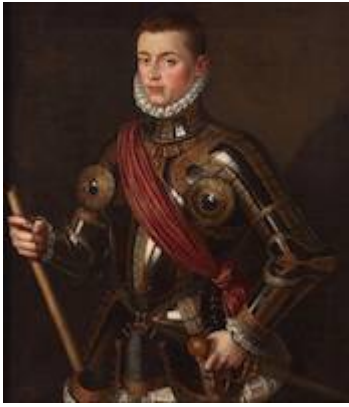
Don Juan de Austria armado. Alonso Sánchez Coello (1567)