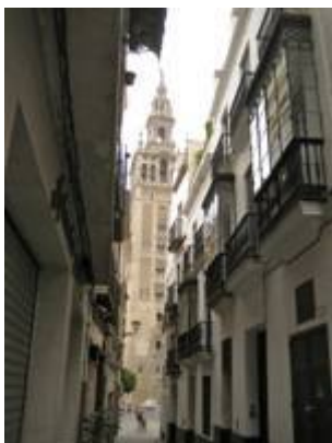
calle Placentines (itinerario de la procesión del Corpus Christi).