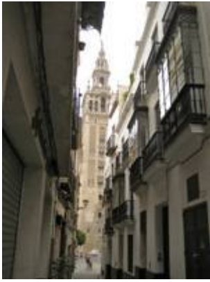
calle Placentines (itinerario de la procesión del Corpus Christi).