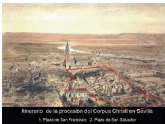
Itinerario de la procesión del Corpus Christi