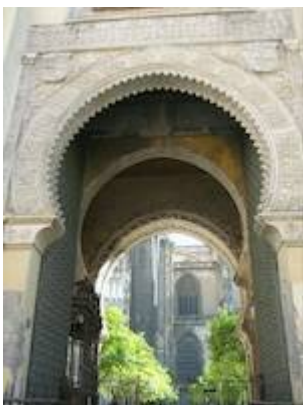
Puerta del Perdón. Catedral de Sevilla