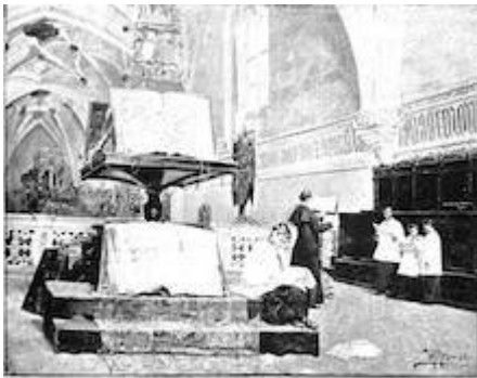
La Real Capilla de Granada.

Obra de la Real Capilla, grabada en la Capilla de Granada.