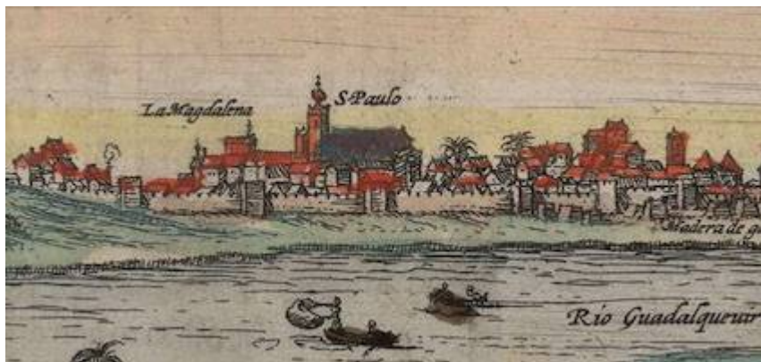
Convento de San Pablo. Sevilla (c. 1565). Joris Hoefnagel. Civitatis orbis terrarum , vol. 1 (1572)

"http://www.youtube.com/embed/W3VwXInqu4?iv_load_policy=3&fs=1&origin=http://www.historicalsoundscapes.com"