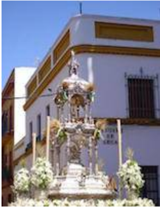
Custodia de la procesión del Corpus Christi en Triana (1712-1726).