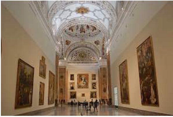
Iglesia del antiguo convento de la Merced