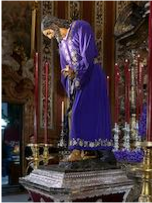
Nuestro Padre Jesús de la Pasión. Juan Martínez Montañés (c. 1615)