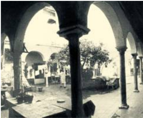
Antiguo claustro del convento de las Vírgenes