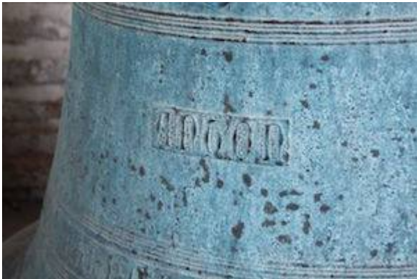
Campana de la iglesia de Santa Bárbara (detalle 1). Écija (Sevilla). Antón López (1411).