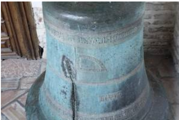
Campana de la iglesia de Santa Bárbara (detalle 2). Écija (Sevilla). Antón López (1411).