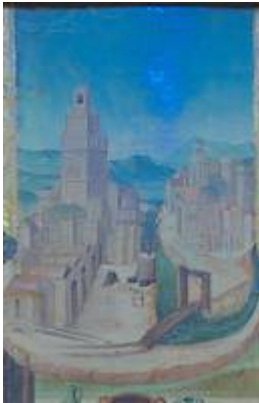
Santas Justa y Rufina (detalle). Anónimo (c. 1515)