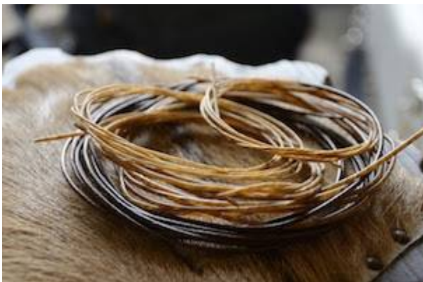
Cuerdas de tripa natural