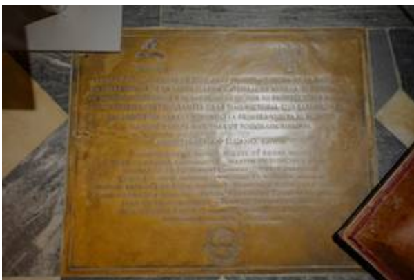
Placa conmemorativa de la visita de los supervivientes de la expedición Magallanes-Elcano a la capilla de la Antigua (2011). Fotografía de Daderot (2)