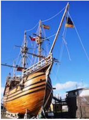
Réplica de la nao Victoria en Punta Arenas (Chile)