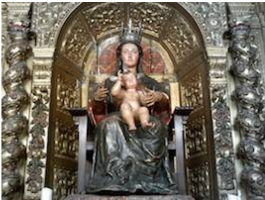
Virgen de la Victoria. Anónimo (s. XVI). Actualmente en la iglesia de Santa Ana