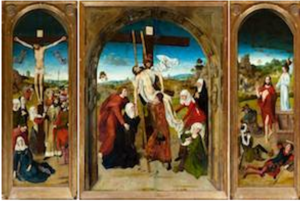
Triptico de la Pasión. Dieric Bouts