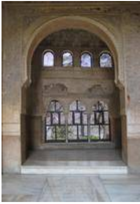
Capilla del convento de San Francisco de la Alhambra (interior).