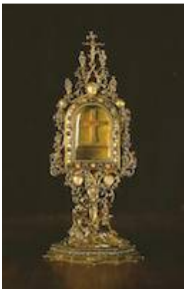
Relicario con lignum crucis. Capilla Real