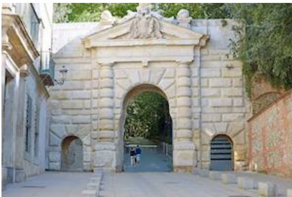
Puerta de los Gómez (c. 1536).