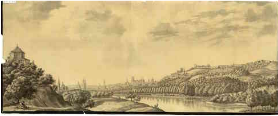
Vista de Granada desde el río Genil. Henry Swinburne (1775)