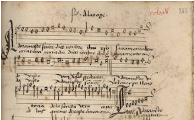
Adorámoste, Señor. Francisco de la Torre. Cancionero Musical de Palacio , fol. 275r