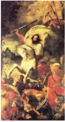
Santiago en la batalla de Clavijo. Juan de Roelas (1609). Capilla de Santiago