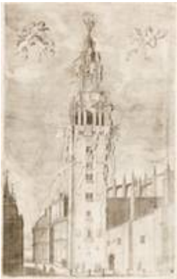
Giralda engalanada. Matías de Arteaga (1672)