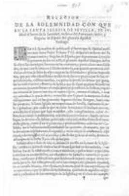
Relación de la solemnidad con que en la Santa Iglesia de Sevilla, se publicó el breve de su Santidad, en favor del Patronato, único, y singular de España del glorioso Apóstol Santiago. [Sevilla, 1623].