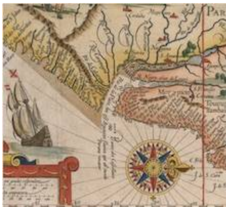
Río de la Plata. Jan Huygen Van Linschoten (1596)