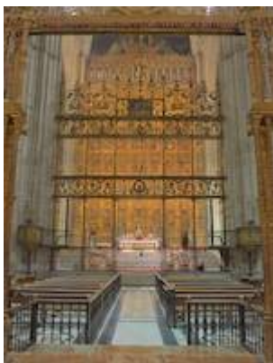
Entre coros. Catedral de Sevilla.