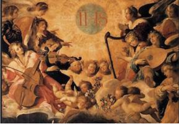
La circuncisión de Cristo. Juan de Roelas (1604-1605)