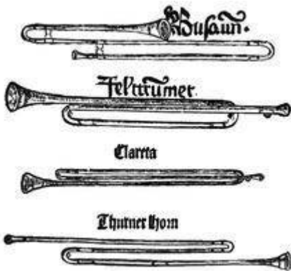
Trompetas. Musica getuscht und angezogen . Sebastián Virdung (1511)