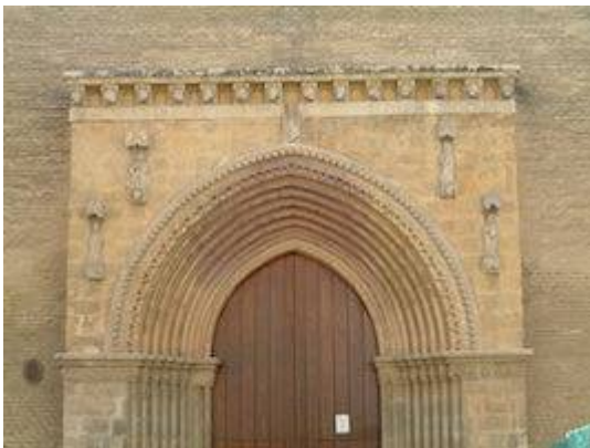
Portada de la iglesia de Santa Marina.