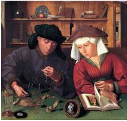
El cambista y su mujer . Quentin Matsys (1514)