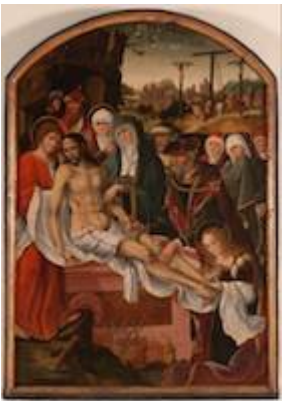
El entierro de Cristo. Cristóbal de Morales (c. 1522)