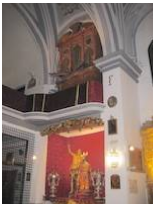
Órgano del convento de la Madre de Dios (Comendadoras de Santiago).