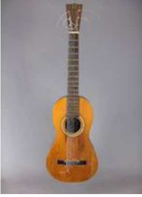
Guitarra (1). Agustín Caro (1824). Colección particular de Aarón García Ruiz. Fotografía de Aarón García Ruiz