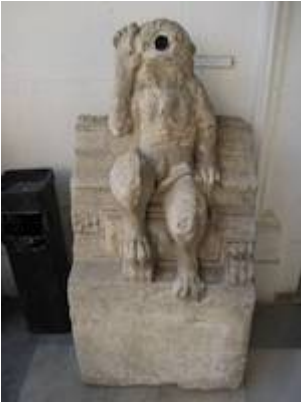
Gárgola (2). Convento de San Francisco Casa Grande (s. XV). Museo Arqueológico de Sevilla.