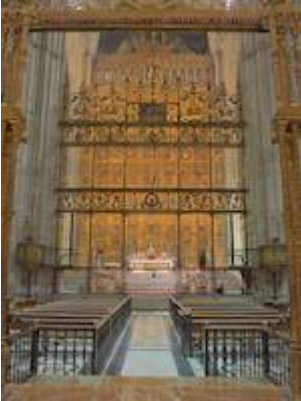
Entre coros. Catedral de Sevilla.