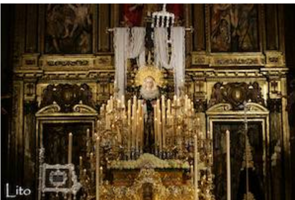
Virgen de la Soledad (finales del siglo XVI). Anónimo.