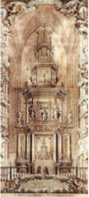
Monumento de la catedral de Sevilla (grabado)