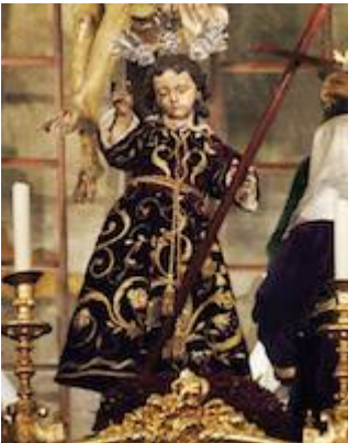
Niño Jesús (cofradía del Nombre de Jesús). Jerónimo Hernández (1580).