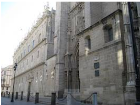
Iglesia del Sagrario y calle de las Gradas.