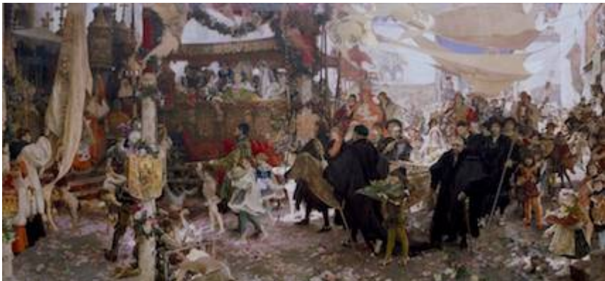
Cortejo del bautizo del príncipe don Juan, hijo de los Reyes Católicos, por las calles de Sevilla. Francisco Pradilla y Ortiz (1910)