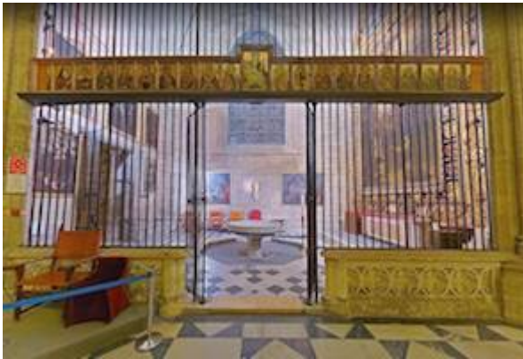
Capilla del Bautismo. Catedral de Sevilla