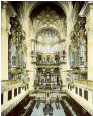
Coro de la catedral de Granada