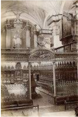
Coro de la catedral de Lima (emplazamiento original)