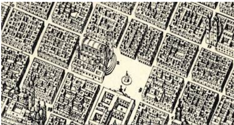
Plano de la Ciudad de los Reyes del Peru en 1744