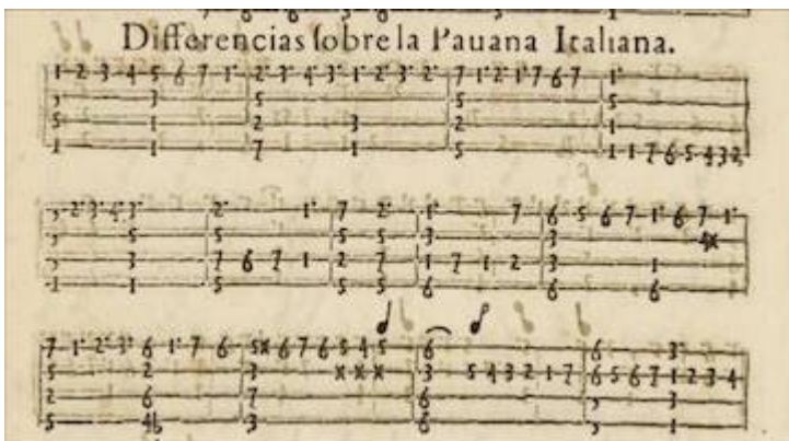
Diferencias sobre la pavana italiana . Antonio de Cabezón. Libro de cifra nueva para tecla, harpa y vihuela (1557), fol. 190v