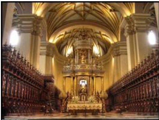
Coro de la catedral de Lima