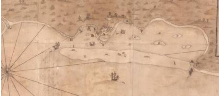
Luanda (siglo XVII)