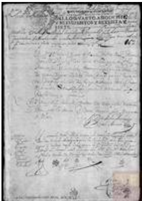
Ministriles negros esclavos para la catedral de Panamá