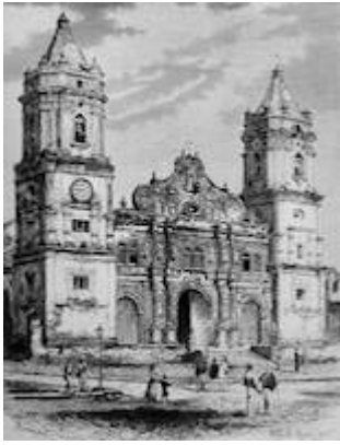
Catedral de Panamá (siglo XIX)