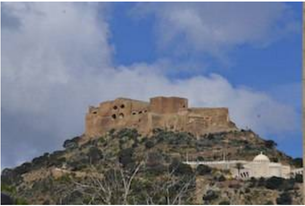
Castillo de Santa Cruz.